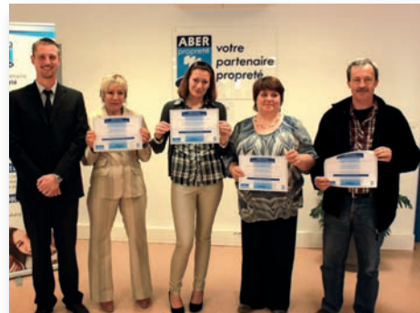
Remise des diplômes 2014