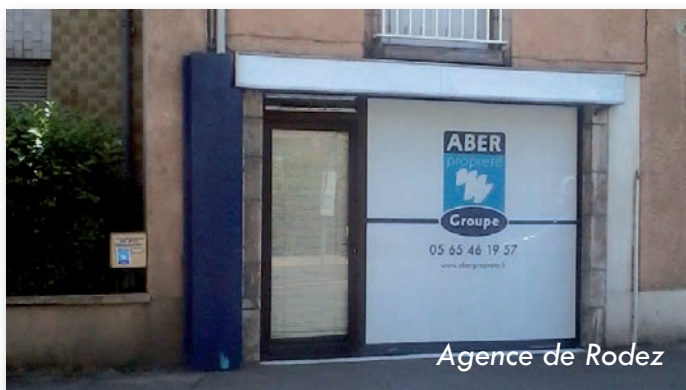
Agence de Rodez