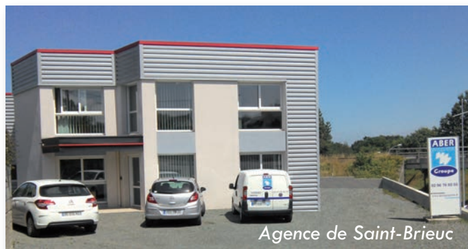
Agence de Saint-Brieuc

Il a tout de même fallu à l'équipe de l'agence quelques jours d'adaptation pour s'orienter dans ses nouveaux locaux. Passer de 150 à 390 m 2 peut être quelque peu perturbant.