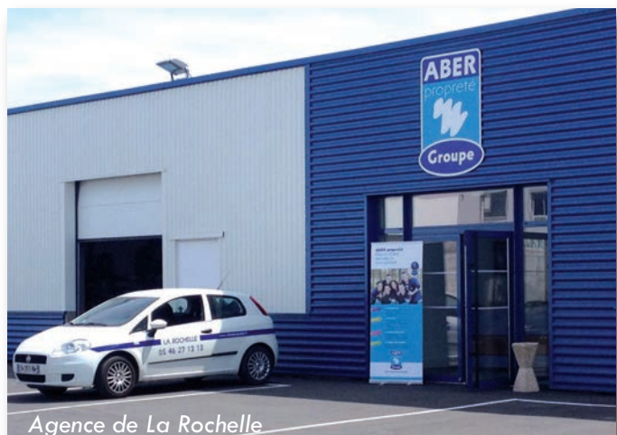
Agence de La Rochelle